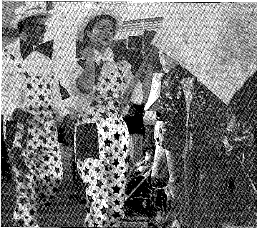
'Los Marchosos' se reincorporan al Carnaval.